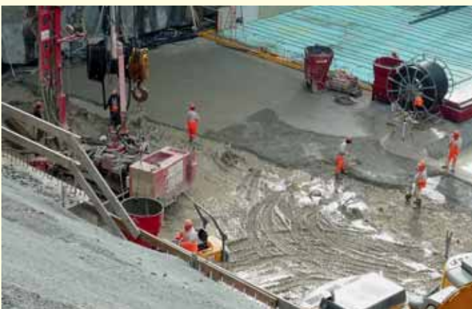
Abb. 4 · Erdwärmesondenfeld HPL mit 101 x 200m GEROtherm Erdwärmesonden unter der Bodenplatte. Aushub, Bohrungen, Verrohrung und Bauarbeiten in enger zeitlicher Abfolge

Baustelle: ETH Life Science Schafmattstrasse 22 CH-8049 Zürich Bauherr: ETH Zürich Immobilien CH-8092 Zürich Generalpartner: Burkhardt+Partner AG CH-8022 Zürich Bauleitung: Perolini Baumanagement AG CH-8034 Zürich Baugruben Aushub: Marti AG Bauunternehmung CH-8050 Zürich Planer Geothermie-Anlage: Geowatt AG Swiss Geothermal Expert Group Dohlenweg 28 CH-8050 Zürich www.geowatt.ch Ausführende Bohrfirma: Thermatech AG Öko-Energie Julierstrasse 85 CH-7453 Tinizong www.thermatech.ch Eingesetztes Produkt: 101 Stk. HakaGerodur Geotherm Erdwärmesonden L=200m/PE 100-RC DE 40mm x 3.7 inkl. Anbindung www.hakagerodur.ch