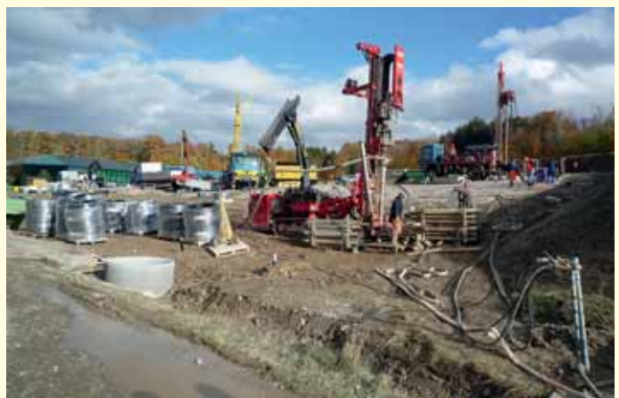
Abb. 5 · Erdwärmesondenfeld HC mit 128 x 200m GEROtherm Erdwärmesonden.