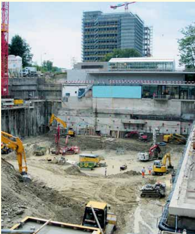
Abb. 2 · Baugrube Erdwärmesondenfeld HPL.

Im Sinne der Qualitätssicherung wurden alle Hinterfüllun-